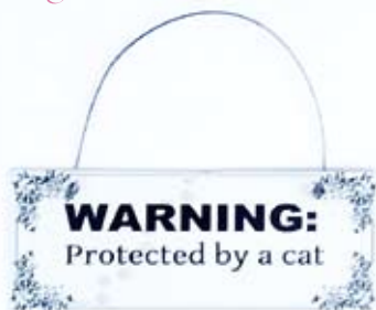
Str. 13 x 5 cm Produktkode: MS1016