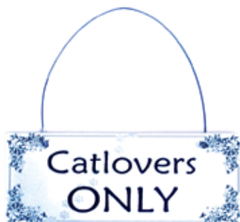
Str. 13 x 5 cm Produktkode: MS1014