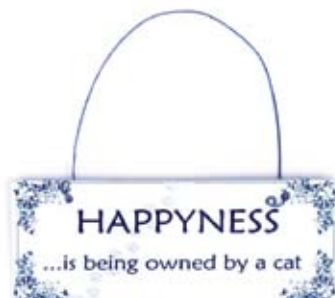
Str. 13 x 5 cm Produktkode: MS1017

For bestilling ring 55 16 95 10 eller send mail til post@kattensvern.no . Innbetalingsgiro følger med i pakken.