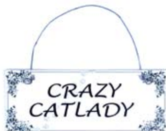
Str. 13 x 5 cm Produktkode: MS1015