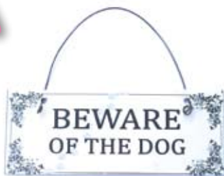
Str. 13 x 5 cm Produktkode: MS1012